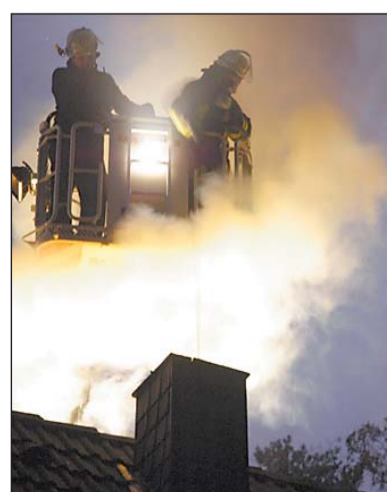
Der Kamin ist ausgebrannt, dichter Qualm umhüllt die Feuerwehrleute.

Senne (WB). Sehr glimpflich ist gestern Abend zwischen 18 und 19 Uhr ein Kaminbrand an der Waterboerstraße 14 verlaufen. Es gab keine Verletzten, und das Haus wurde nur geringfügig beschädigt.