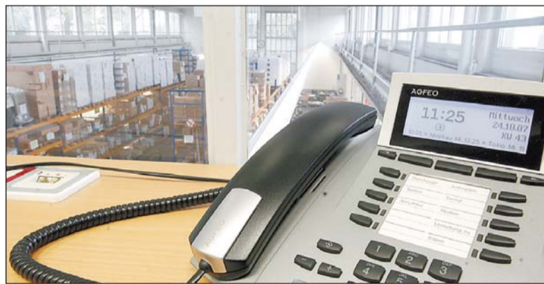
Einblicke: Bevor Agfeo 1947 die Gebäude an der Gaswerkstraße bezog, wurden während des Zweiten Weltkrieges Landungs- und Schnellboote in dieser Produktionshalle gefertigt. Heute dient sie als Lager.