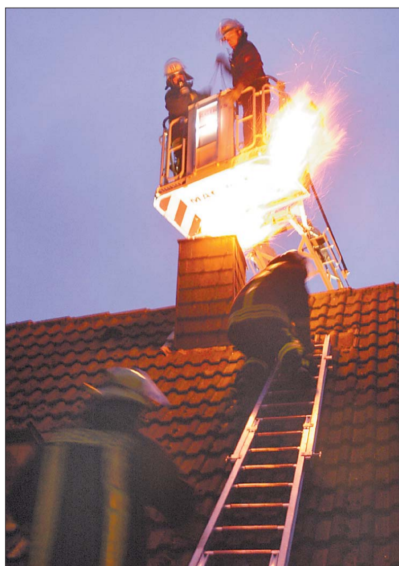
Als zwei Feuerwehrleute den Schornstein von der Drehleiter aus mit einem Kettenkehrgerät bearbeiten, treten gefährlich große Flammen aus.

Unter Atemschutz versuchten zwei Männer von einer Drehleiter aus, den brennenden Kamin mit einem Kettenkehrgerät zu befreien. Während der Schornstein kontrolliert ausbrannte, entsorgten andere Feuerwehrleute die glühenden Partikel, die in den Kamin durchfielen. Wasser kam nicht zum Einsatz. Es hätte im Schornstein zu Explosionen geführt. Nach 45 Minuten hatte die Feuerwehr die Lage gänzlich im Griff, ohne dass das Feuer auf den Dachstuhl übersprungen war.